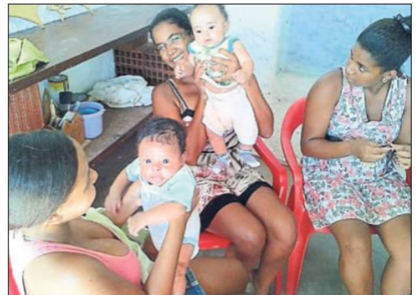
Für 50 bis 60 Jugendliche ist Hakuna Matata eine Anlaufstelle, darunter sind auch junge Mütter.